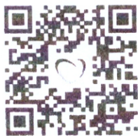
QR Code ลงทะเบียนออนไลน์

จึงเรียนมาเพื่อโปรดพิจารณาให้บุคลากรในหน่วยงานเข้ารับการประชุม และขอความอนุเคราะห์ ทราบ ดำเนินการตามเสนอ