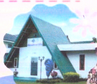
พิพิธภัณฑ์การได้ยิน