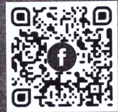
ศูนย์เครือข่ายเภสัชสนเทศ "ประชานาถ"