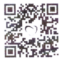
QR Code ลงทะเบียนออนไลน์

จึงเรียนมาเพื่อโปรดพิจารณาให้บุคลากรในหน่วยงานเข้ารับการประชุม และขอความอนุเคราะห์เผยแพร่ข้อมูลดังกล่าวให้ทราบโดยทั่วกันด้วย จะเป็นพระคุณยิ่ง